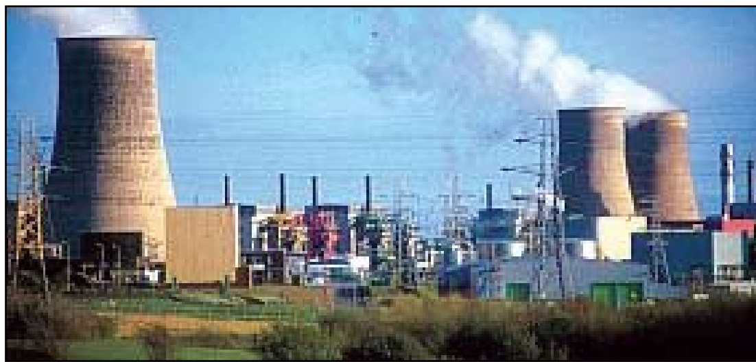
Sellafield-anlegget i England. Illustrasjonsfoto.